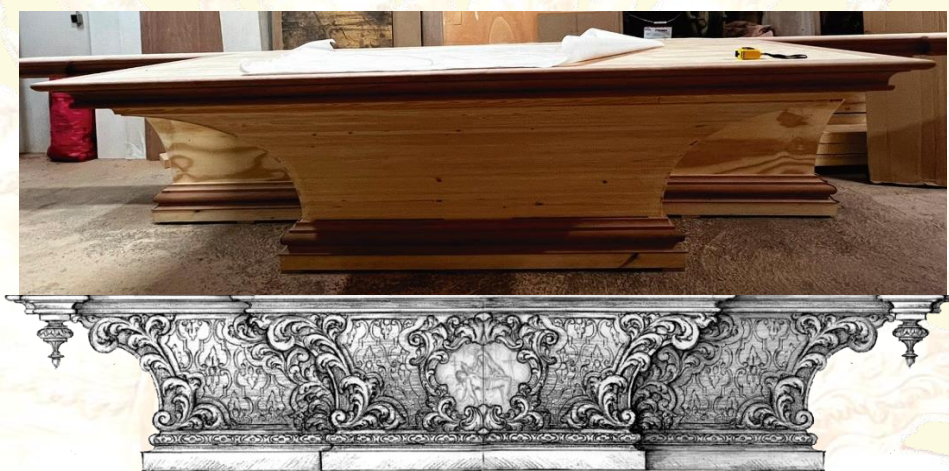
FIGURA 1. FASE 1 DEL RETABLO. BANCO DE ALTAR

Desde que el pasado 8 de septiembre de 2023, festividad de la Natividad de la Santísima Virgen María, se firmó el contrato con el tallista y el carpintero para la ejecución de nuestro nuevo retablo, el gran proyecto en el que se encuentra inmersa nuestra Hermandad no deja de trabajar y de avanzar. A lo largo del último trimestre de 2023 comenzó la primera de las fases en las labores de carpintería. Esta primera fase (como aparece en la Figura 1) es el banco sobre el que se asienta el retablo.