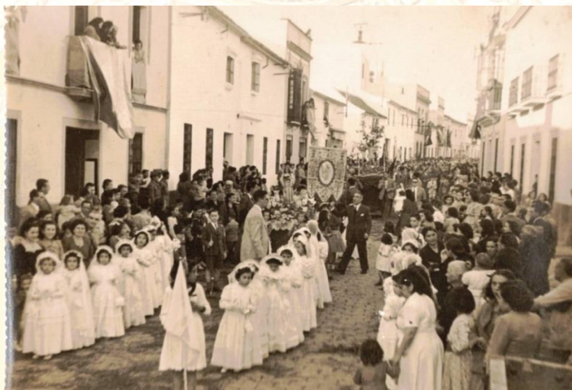
El cortejo avanza por la calle Mairena, esquina con la Callejuela del Carmen.

En esta imagen observamos a niñas vestidas de comunión delante del antiguo Simpecado de María Auxiliadora, el cual aún se conserva. Se aprecia también unas andas llevadas por niños portando lo que parece ser la imagen de la Virgen con un libro. En el fondo de la imagen podemos contemplar también las andas de una pequeña imagen de San Sebastián, que formaba parte del cortejo.