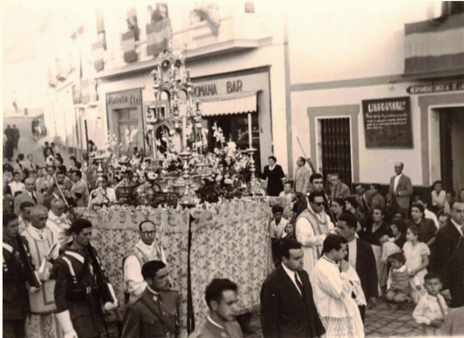
El paso de la Custodia pasando por delante del entonces "Bar Oromana" y a su derecha la Hermandad de Laboradores.

En esta imagen observamos a niñas vestidas de comunión delante del antiguo Simpecado de María Auxiliadora, el cual aún se conserva. Se aprecia también unas andas llevadas por niños portando lo que parece ser la imagen de la Virgen con un libro. En el fondo de la imagen podemos contemplar también las andas de una pequeña imagen de San Sebastián, que formaba parte del cortejo.