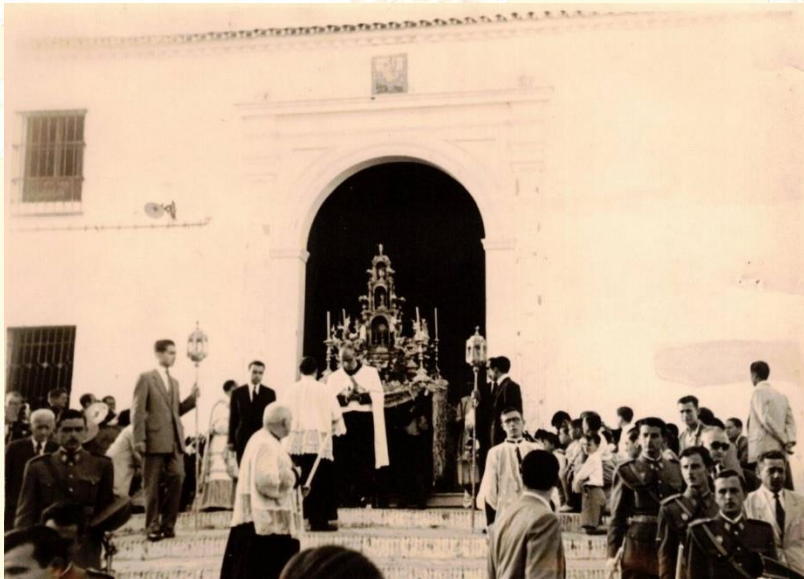
Imagen del paso de la custodia en la puerta de la Parroquia.