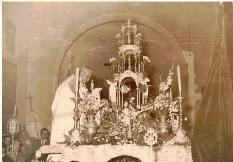
Imagen del paso de la delante de la capilla de Ánimas de nuestra Hermandad.

La Hermandad Sacramental de San Sebastián, fusionada en la actualidad con la Hermandad de la Amargura, ha jugado un papel fundamental en la vida religiosa y cultural de nuestra localidad. Desde su fundación, en la primera mitad del siglo XVI, la hermandad ha tenido un rol esencial asegurando que las celebraciones litúrgicas, especialmente durante la Octava del Corpus, se lleven a cabo con el debido honor y reverencia.