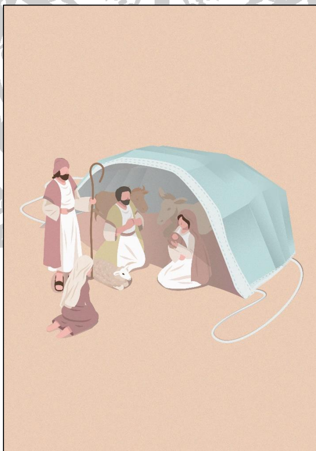
Ilustración: D. Rafael Rodríguez García

Gloria a Dios en el cielo y en la tierra, paz a los hombres que Dios ama.